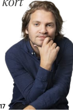
Del 1, sidan 17