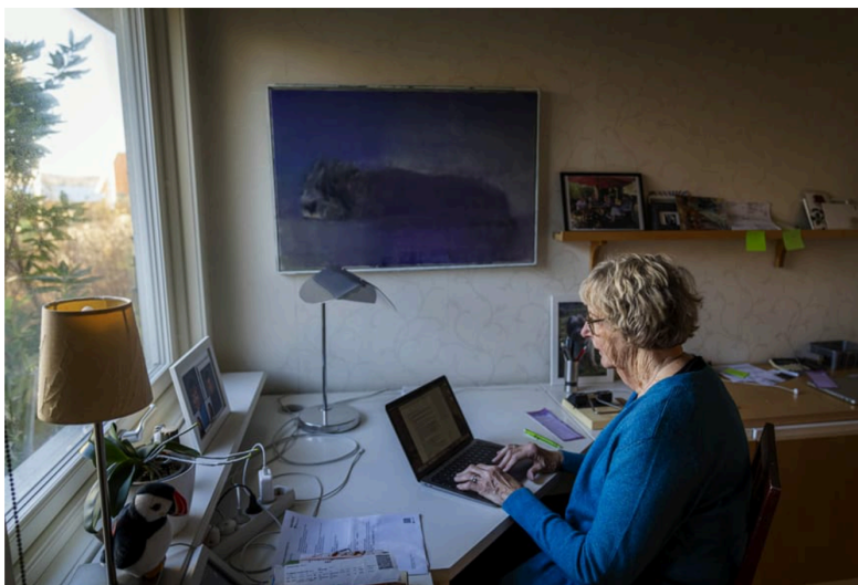
Sedan hon gick i pension har hon också fått ett stort intresse för släktforskning: "Man fortsätter vara nyfiken".