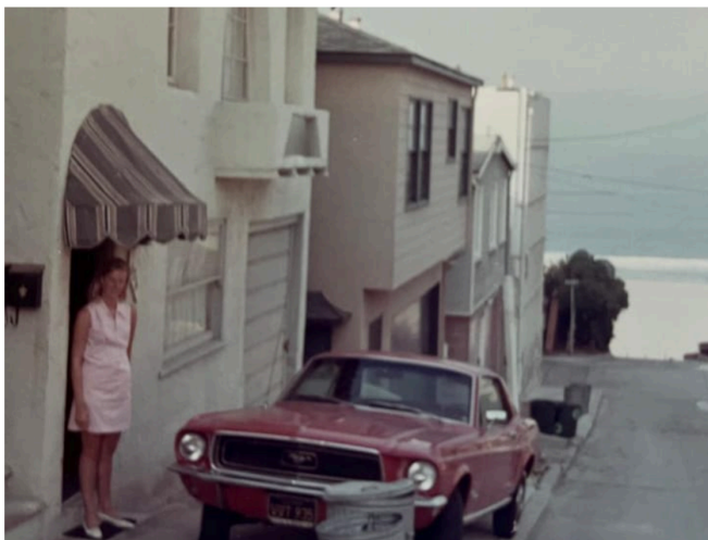
Kerstin utanför lägenheten i Manhattan Beach 1969.